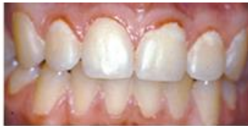
og tandkødsbetændelse - hos samme patient