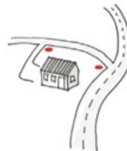
Du må placere dit skilt ved de røde punkter